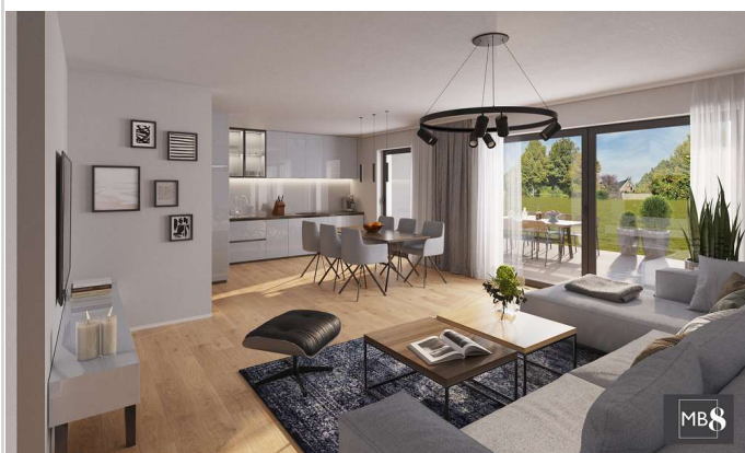
MB 8 Hoterhof Vis. Wohnen