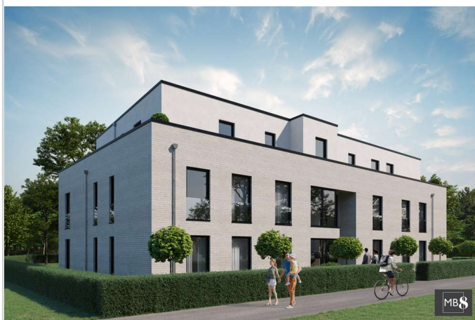
MB 8 Hoterhof Vis. Nord Westen