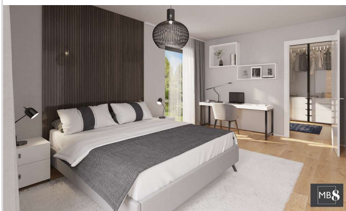
MB 8 Hoterhof Vis. Schlafen