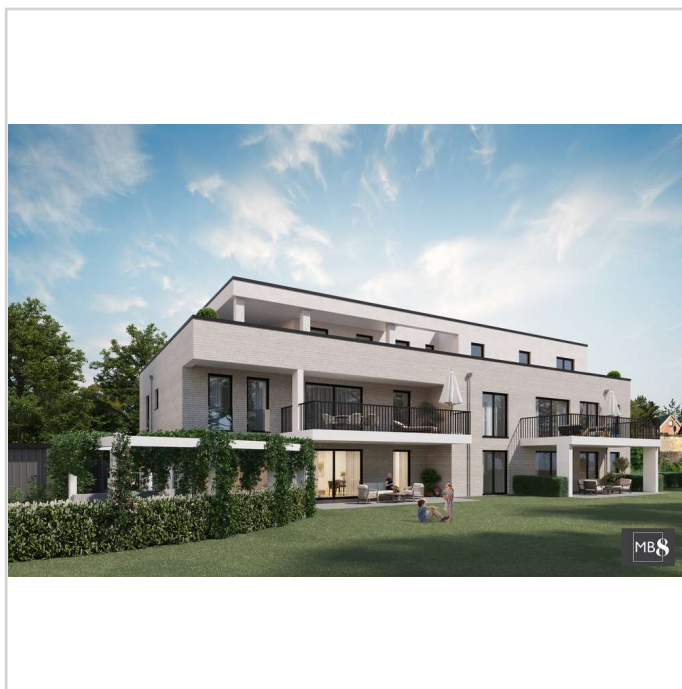
MB 8 Hoterhof Vis. Garten

Meerbusch-Osterath besticht durch die perfekte Verkehrsanbindung über die nahegelegenen Autobahnanschlüsse A 57 und A 44 sowie der U-Bahnhaltestelle „Hoterheide“ mit der Verbindung nach Düsseldorf und Krefeld. Mit der Deutschen Bundesbahn erreicht man sämtliche Fernziele direkt vom Bahnhof Osterath aus. Der Düsseldorfer Flughafen ist ca. 15 Minuten entfernt.