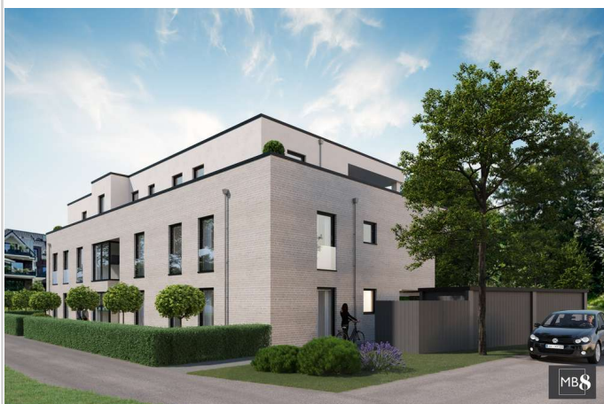
MB 8 Hoterhof Vis. Westen

Zimmer: 4,00 Wohnfläche ca.: 157,00 m 2 Kaufpreis: 949.000,00 EUR